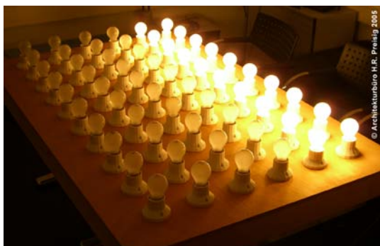
Morgen: 20 Glühbirnen. Für das Wohnen + Arbeiten bleiben davon noch 8 - 9 Glühbirnen