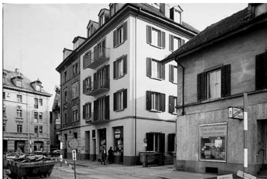
Standard C, Erhalt Bausubstanz bei tiefen Mietzinsen, Bsp. Köchlistrasse