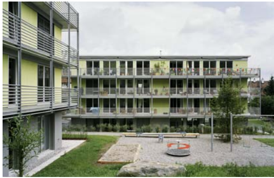
Standard A, Neubau, Bsp. Bockler

Wir verstehen darunter z.B.: gesunde Umwelt, gesunder Innenraum, einfacher Gebäudeunterhalt, tiefe Bau - + Betriebskosten“.