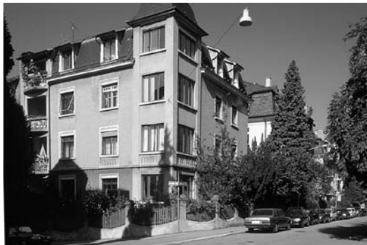
Standard B, Zeitgemässer Komfort für Mittelstand, Bsp. Büchnerstrasse