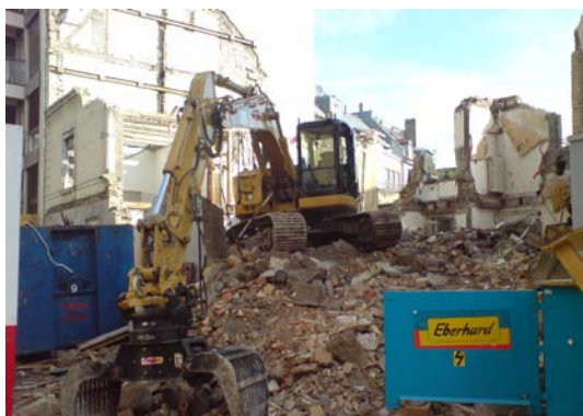
Standard D, Abbruchliegenschaft, Bsp. Grüngasse

In den 4 Standards selber ist festgehalten, dass die zeitgemässen Erkenntnisse der Bauökologie eingehalten werden müssen. Die dazugehörige Definition für die Bauökologie lautet: „Bauökologie umfasst die Bereiche Baubiologie (Materialien nach Umwelt- und Wohnaspekten) und Energie (Energieerzeugung, -verbrauch und -effizienz, sowie Graue Energie)“.