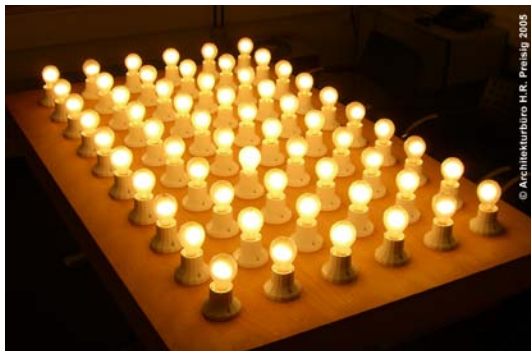
Heute: 60 Glühbirnen mit je 100 Watt pro Person in Westeuropa

Hauptbedingung zur Erreichung dieser Zielvorgabe ist die Reduktion des Verbrauchs fossiler Brennstoffe (Primärenergieträger Öl und Gas) und der damit verbundene geringere CO 2 Ausstoss.